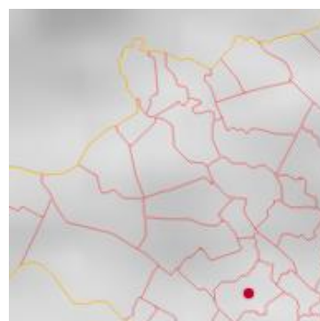
Ảnh mây vệ tinh

2. Cảnh báo khả năng xuất hiện: Trong khoảng thời gian từ bây giờ đến 03 giờ tới, khối mây này tiếp tục phát triển gây mưa rào và dông cho khu vực TP Long Xuyên và các huyện Tri Tôn, Thoại Sơn, Châu Thành, Châu Phú, Chợ Mới, Phú Tân,... sau đó có khả năng tiếp tục lan sang khu vực lân cận. Cần đề phòng các hiện tượng thời tiết nguy hiểm như gió giật mạnh, lốc, sét và mưa lớn cục bộ.